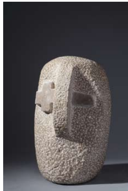
▲ Ivan , 2005. kamen dolit 36 × 22 × 29 cm