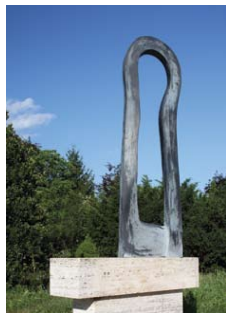
▲▶ Akt , 2011. švedski granit 142 × 40 × 15 cm