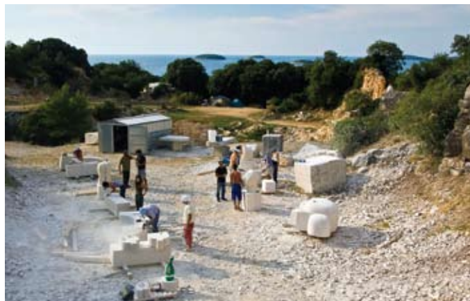
Ljetni kiparski studij, Montraker kraj Vrsara