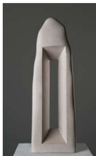
▲ Kapelica perspektiva , 1993. sivac 70 × 23 × 12 cm Snimio Ivan Kuharić, 2011. Vlasništvo Gliptoteke HAZU