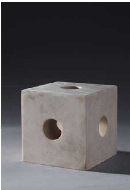
▲ Uskrsnuće (Maketa za Spomenik palim braniteljima Samobora), 2001. kararski mramor 32,5 × 10,5 × 10,5 cm