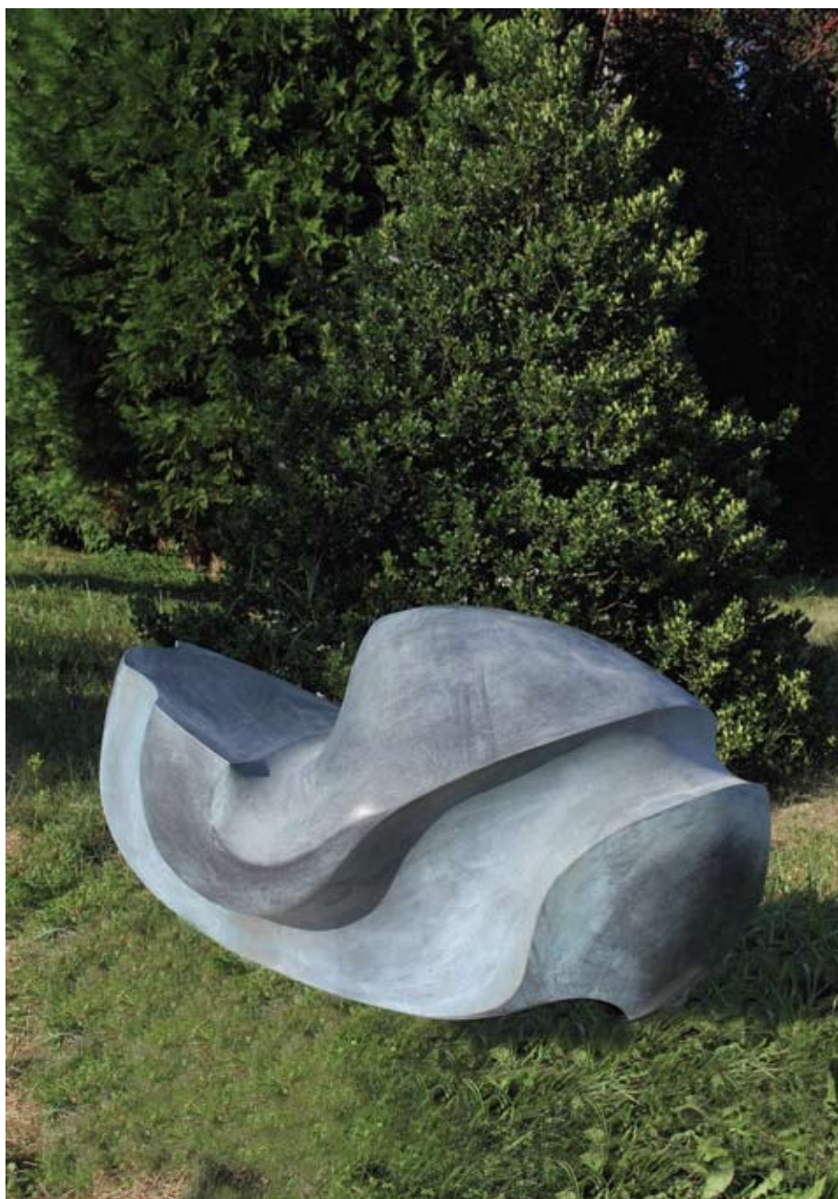
▲ Ležeći akt , 2010. švedski granit 75 × 125 × 65 cm Privatno vlasništvo