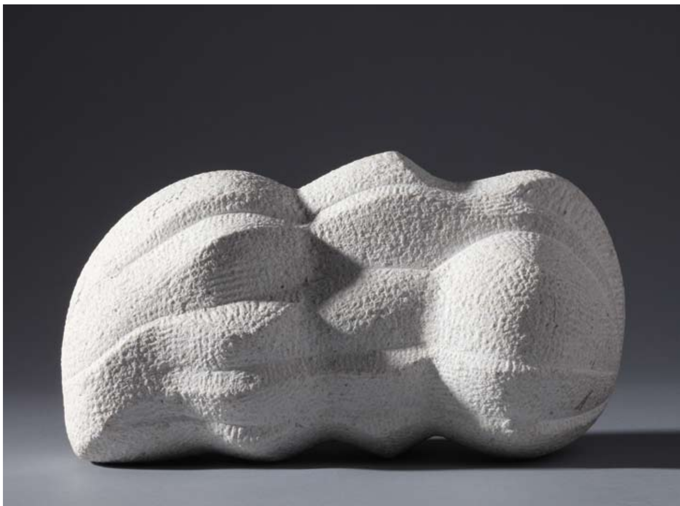
▲ Cvrčak , 1990./1991. veseljski kamen 15 × 34 × 18 cm