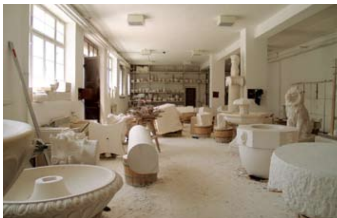
Klesarska škola u Pučišćima