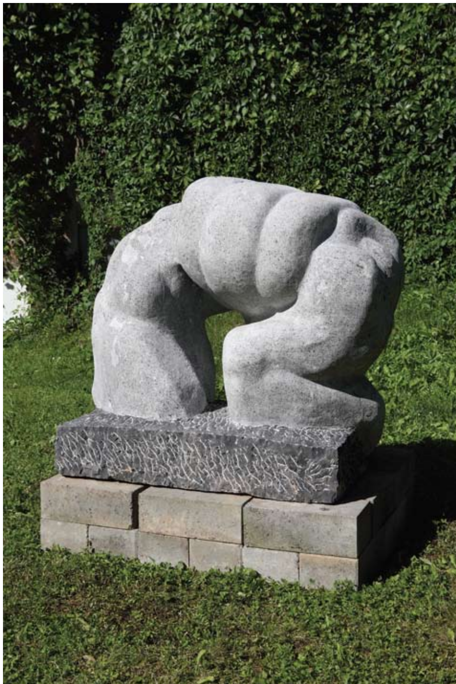
◀▲ Jarac , 1995. šareni mramor visina 45 cm