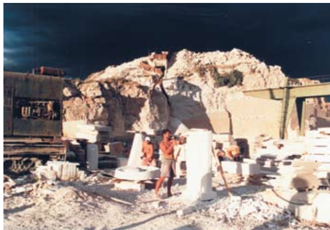
Ljetni studij kiparstva u Pučišćima, 1997. / Summer Course in Sculpting, Pučišća, 1997

In institutions of higher learning, such as the Academy of Applied Arts in Rijeka, the Artistic Academy in Split and the Academy of Visual Arts in Zagreb, masonry and stone processing are some of the skills that future sculptors should adopt. Apart from work in the studios, students of sculpting gain precious experience during their fieldwork in Istria and on Brač, which has been part of various forms of inter-institutional cooperation since 1991. Students of