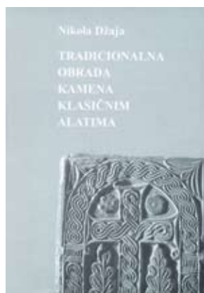
Naslovnica još uvijek ključne knjige za obradu kamena, Umjetnička akademija u Splitu, 1999.

Na visokoškolskim ustanovama, Akademiji za primijenjenu umjetnost u Rijeci, Umjetničkoj akademiji u Splitu i Akademiji likovnih umjetnosti u Zagrebu, klesanje i obrada kamena prisutni su kao jedna od vještina koju bi trebali usvojiti budući kipari. Uz rad u ateljeima, studenti kiparstva dragocjeno iskustvo dobivaju na terenskoj nastavi koja se od 1991. godine u različitim oblicima međuinstitucionalne suradnje održavala u kamenarskim središtima Istre i otoka Brača. Polaznici Ljetnog kiparskog studija u Montrakeru kraj