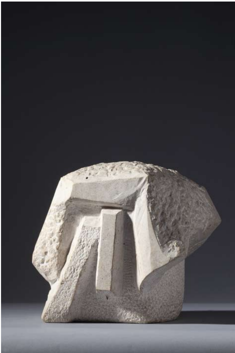
Skulptura u nastajanju, bihacit