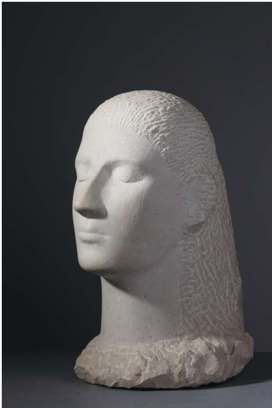
◀▲ Mojsije , 2006. brački kamen (breča) 51 × 20 × 25 cm