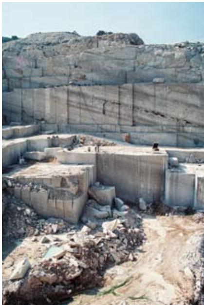
Kamenolom u Pučišćima, potkraj 1990-ih / Quarry in Pučišća, late 1990's

The tradition of stone carving lies in quarries all over Croatia. In a sequence visible like wounds in the landscape, one can trace kave in Istria from Kirmenjaka near Poreč, to Vinkuran near Pula, Kanfanar and