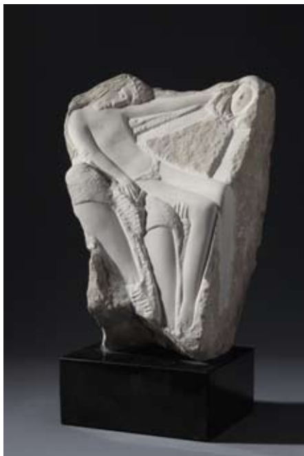
▲ Pieta , 2008. sivac 24 × 27 × 16 cm