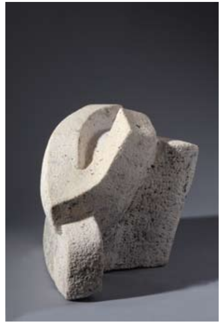
▲ Spartakus , 1999. vinkuranski kamen 31 × 30 × 47 cm