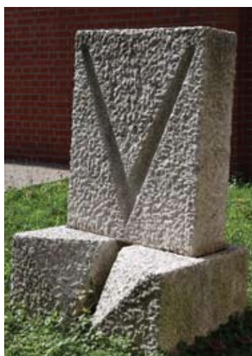
▲ Kamen na kamen , 1999. kanfanarski kamen 136 × 90 × 71 cm Vlasništvo Gliptoteke HAZU