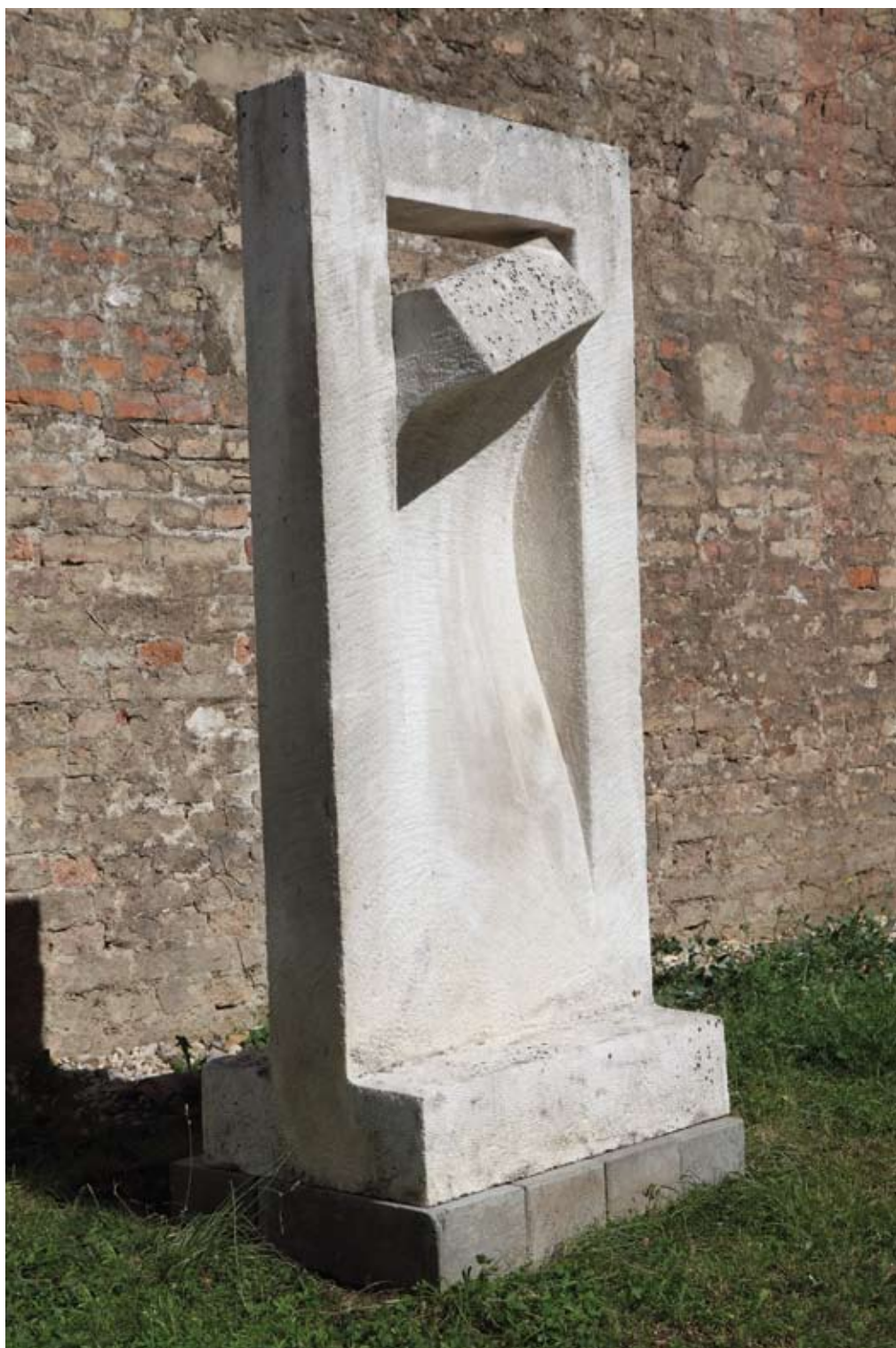
► Vrata , 1997. veseljski kamen 85 × 175 × 45 cm