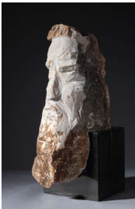
▲ Nikola , 1992. ▲ brački kamen (Grižavica) 18 × 14 × 20 cm