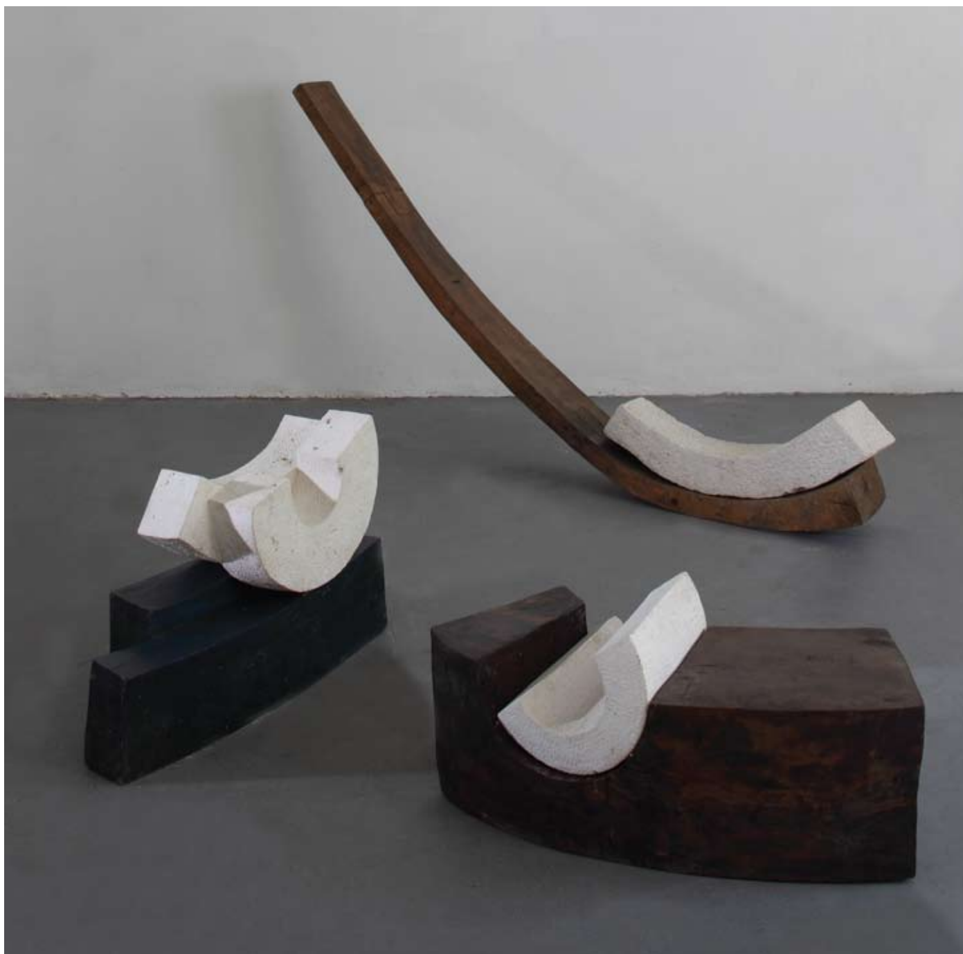
▲ Na lukovima lukovi , 1996. kamen, drvo 110 x 30 x 60 cm