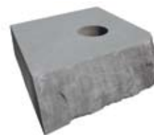
▲ Čuvar duše , 2003./04. mramor 34,5 × 144 × 128 cm