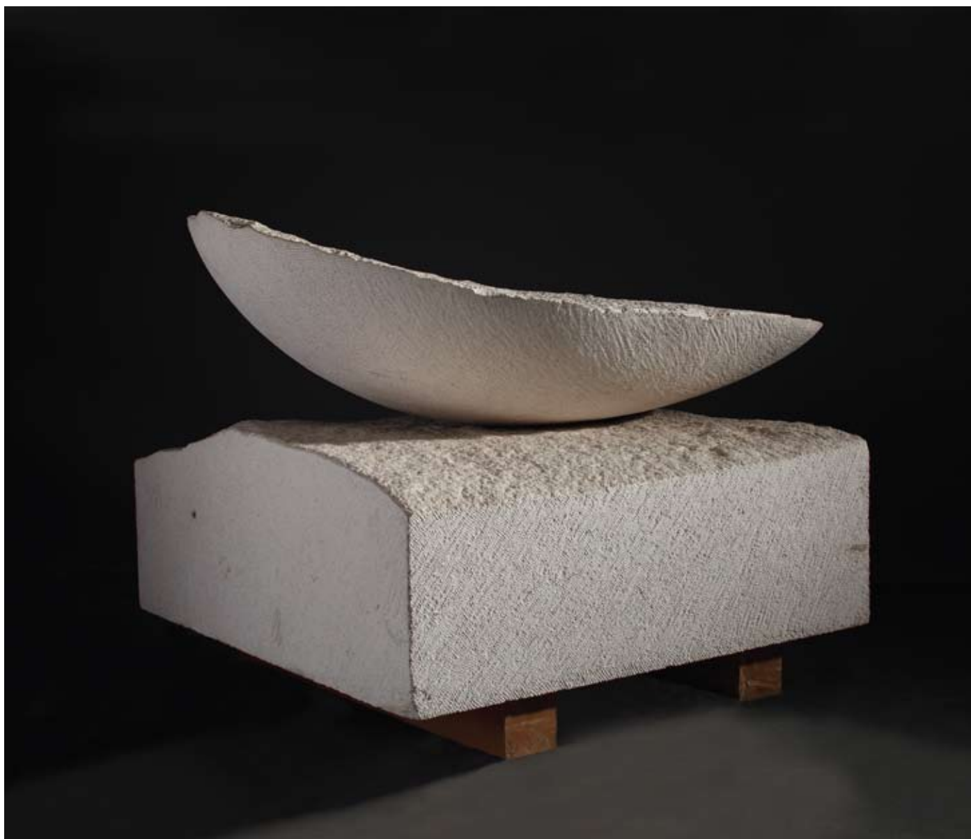
▲ Nestabilni brod , 1998. veseljski kamen 68 × 91 × 125 cm Vlasništvo ALU, Zagreb