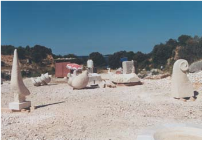
Ljetni kiparski studij Montraker kraj Vrsara / Summer Course in Sculpting, Montraker near Vrsar