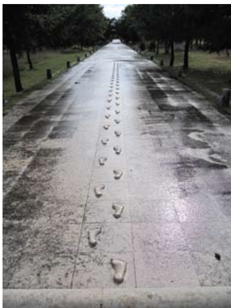
Fragment Bijele ceste, autor Nikola Džaja (snimio Davorin Vujčić, 2011.)

Mediterranski kiparski simpozij u kamenu, najznačajniji hrvatski kiparski simpozij, rođen je daleke 1969. iz nastojanja da se revitalizira barokna Stancija Dubrova kod Labina. Josip Diminić i Branko Fučić, idejni začetnici i utemeljitelji, osmislili su ga ne samo kao mjesto kiparenja i okupljanja kipara, već kao društveno dinamičnu činjenicu, s kiparskim dosezima kao povodom ljudskom sporazumijevanju. U svom četrdesetgodinšnjem postojanju MKS je priskrbio stotinjak skulptura u kamenu, postavljenih u park skulptura Dubrova i širom Hrvatske. Osobit doprinos autentičnosti i originalnosti Mediteranskom kiparskom simpoziju od 1997. godine daje Bijela cesta: pješačka cestica kroz park skulptura, koju svake godine svojom kreacijom u duljini od tridesetak metara produži jedan odabrani umjetnik. Ideja Josipa Diminića i izvedba ovog projekta, sad s već 15 dovršenih dionica, bez sumnje je relevantna u svjetskim razmjerima.