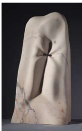
▲ Križ , 2003. portugalski mramor (Rosa Portugal) 85 × 48 × 20 cm