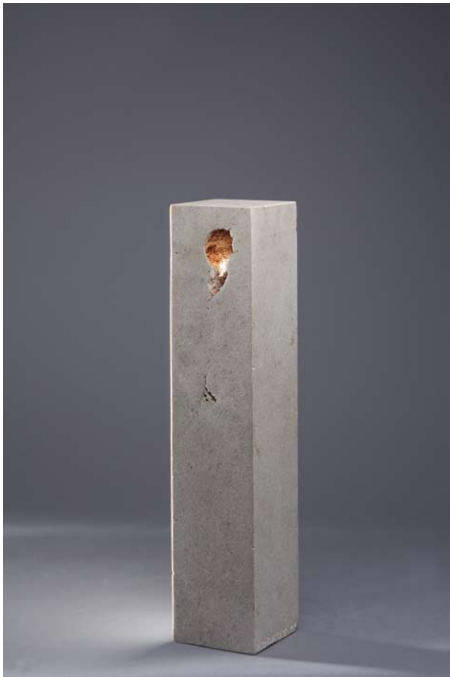
◀▲ Utroba , 1998. kanfanarski kamen 14 × 14 × 14 cm