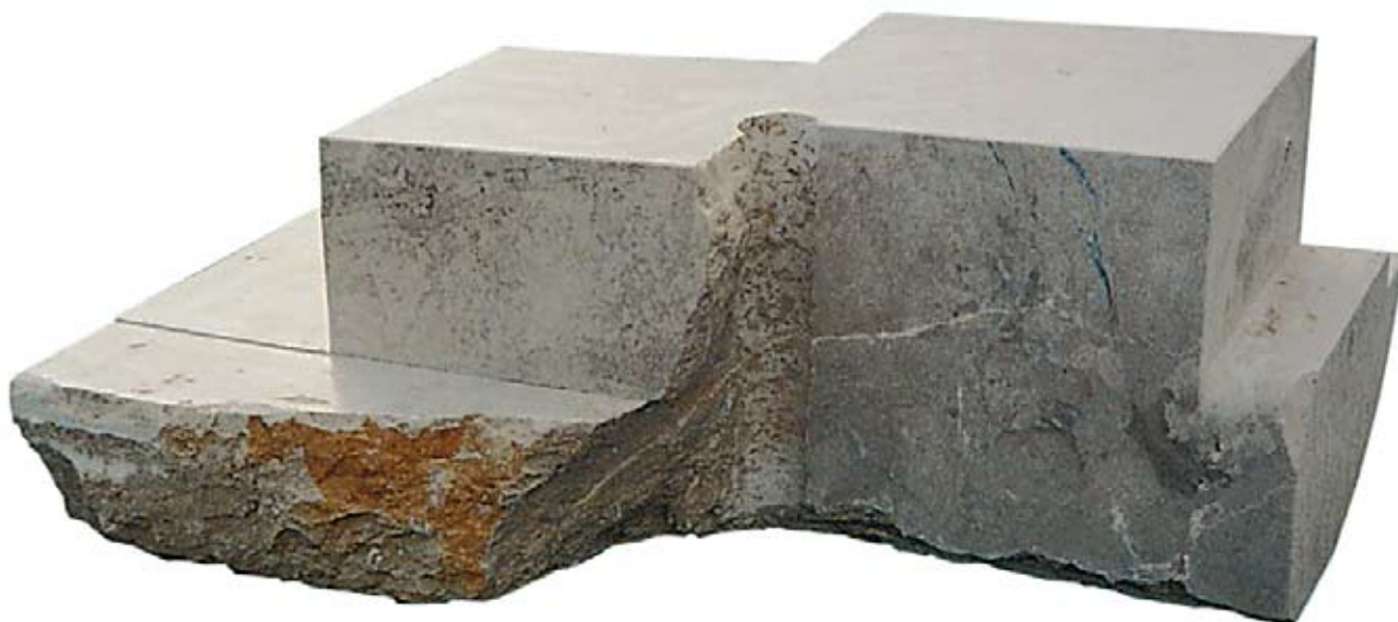
▲ Sjećanje na Tikal , 2001./02. mramor 59,4 × 146,3 × 101 cm