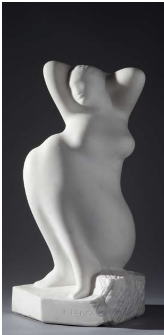
▲ Akt , 2006. mramor 60 × 29 × 31 cm