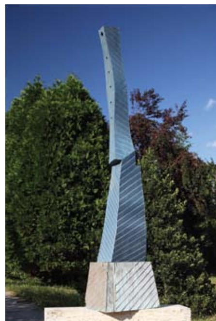
▲ Crni oblik kretanja , 2011. švedski granit 168 × 30 × 20 cm