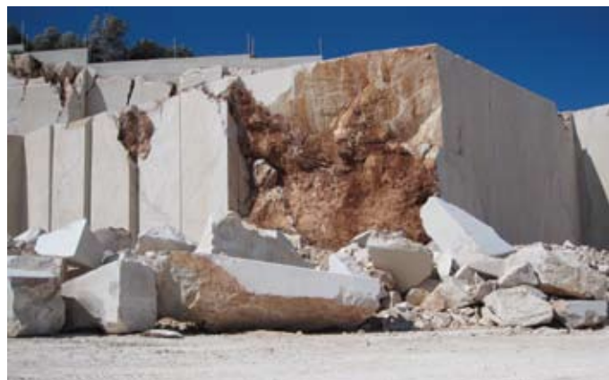
Veseljski kamen, Pučišća (snimio Daslav Petrović, 2011.)

Izložba koja bi oholo smjerala sveobuhvatnoj rekapitulaciji kiparskog stvaralaštva u kamenu u proteklih dvadeset hrvatskih godina, neostvariva je i besmislena ideja: velik dio skulptura ostao je živjeti na mjestima koja su nadahnula stvaranje i odredila postavljanje. No, dostupnim primjerima ukazati na značajnu produkciju u toj najzahtjevnijoj kiparskoj disciplini, svakako je potrebno: kako zbog kipara i njihovih djela, tako i zbog svih nas. Izgleda da je upravo kamenu pripala uloga da svojom čvrstom strukturom – kiparski oblikovanom – bude poveznica tradicije i suvremenosti hrvatske likovnosti.