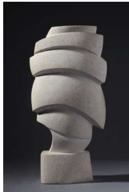
◀ ▲ Jedra , 1997. veseljski kamen 42,5 × 21 × 12 cm