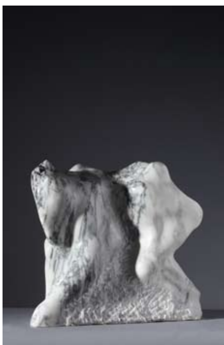
▲ Transformacija , 2004. ▲ brački kamen (sv. Petar) 86 × 48 × 45 cm