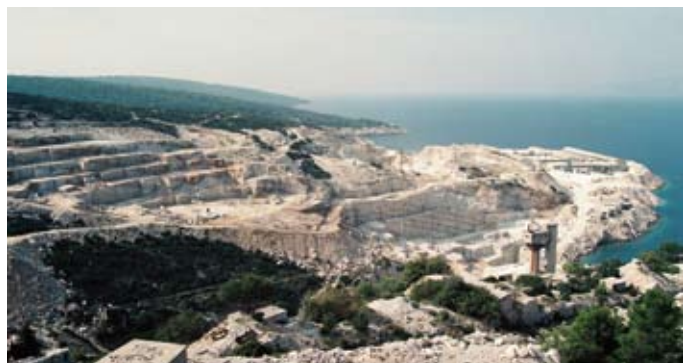
Kamenolom u Pučišćima, potkraj 1990-ih

Posebice je antika zasjekla duboko i intenzivno u tlo Istre i Dalmacije, vadeći kamen za gradnju: primje-