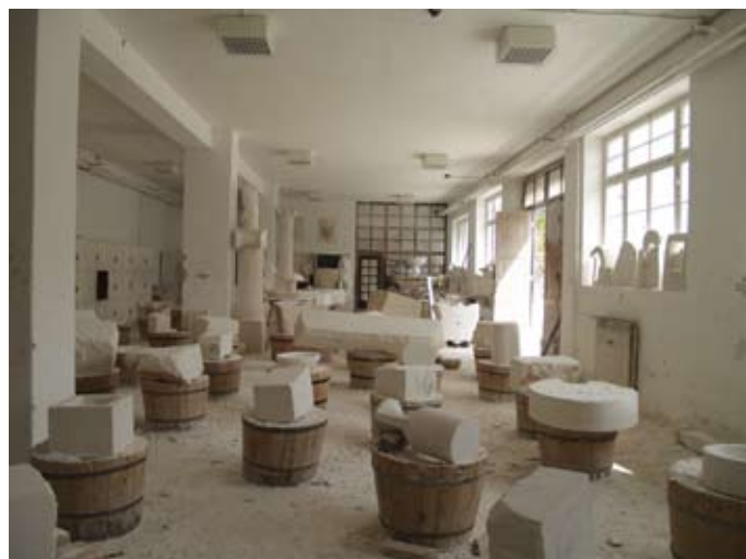
Klesarska škola u Pučišćima / Masonry High School in Pučišća