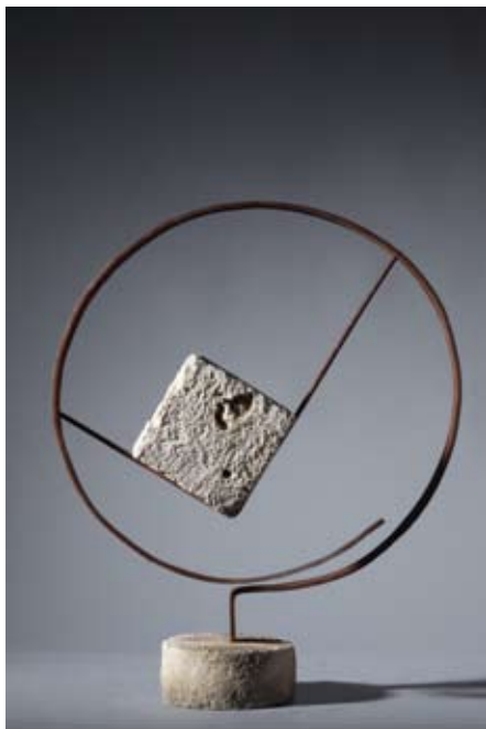
▲► Homage Radovanu V , 2006. brački kamen (sv. Petar), metal 52 × 62 × 15 cm Privatno vlasništvo