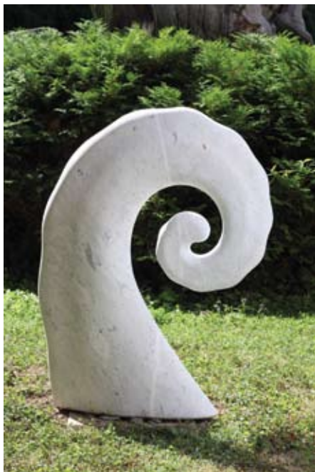
▲ Imaginacija I , 1991. kararski mramor 95 × 80 × 18 cm