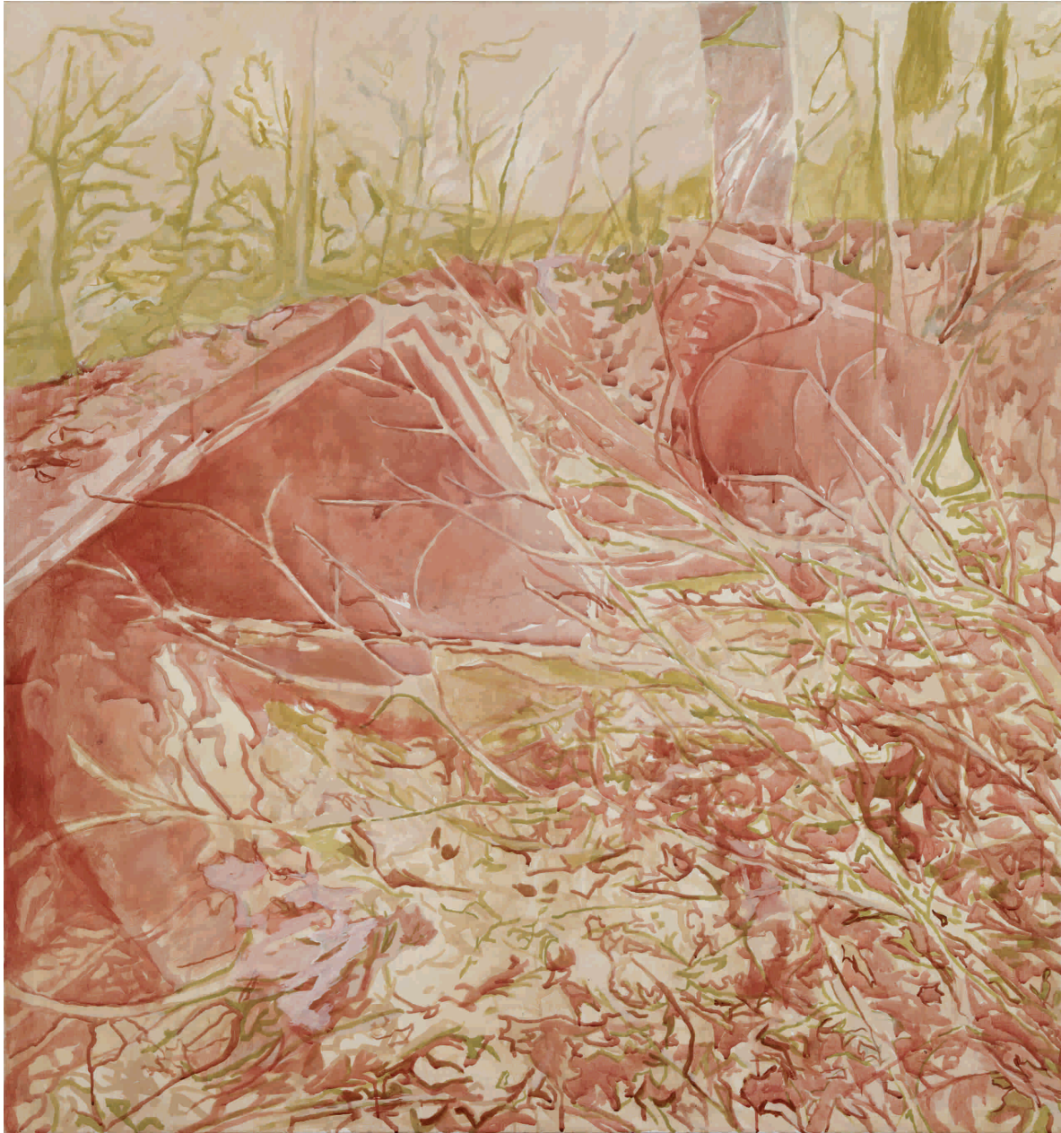
Šuškanje , 2012. Akril na platnu 140x150 cm