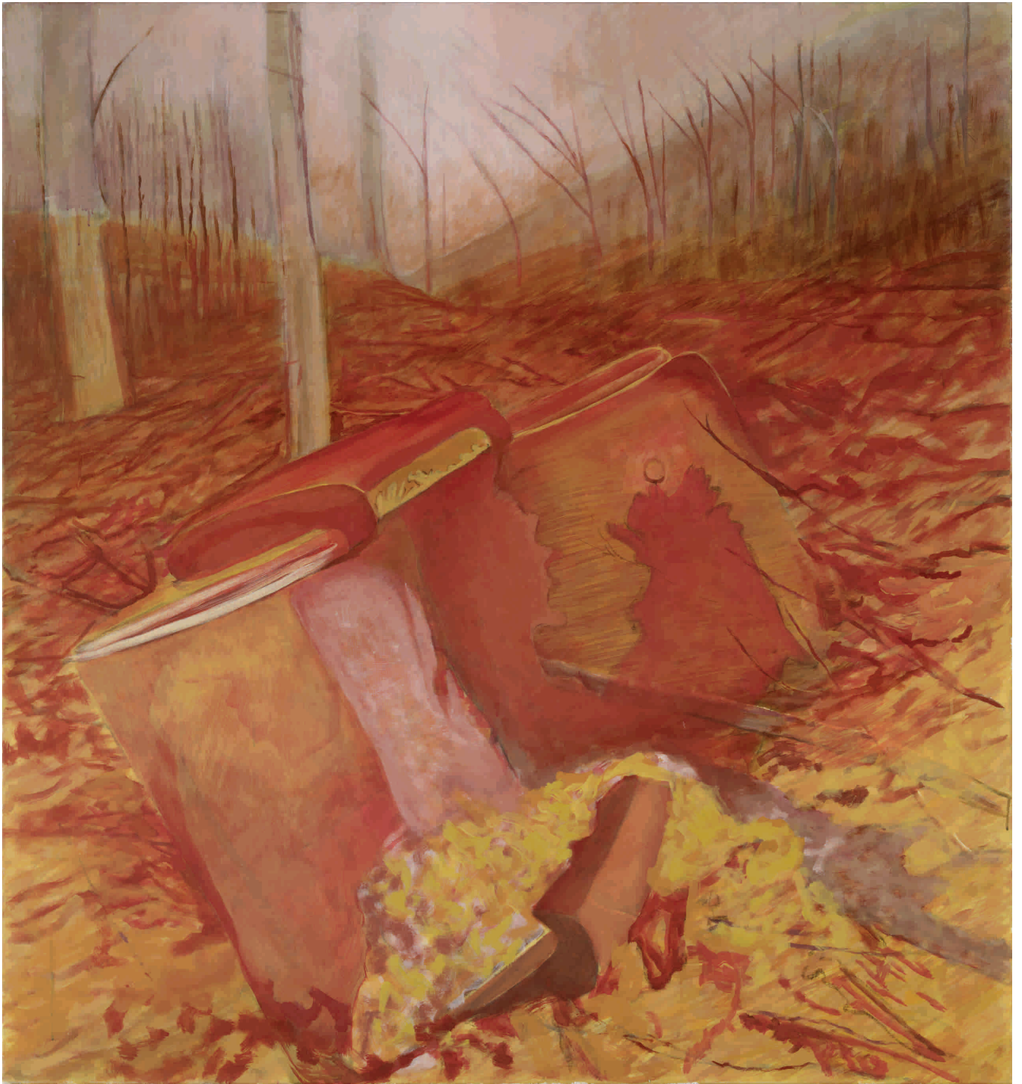
Mimikrija , 2012. Akрил na platnu 140x150 cm