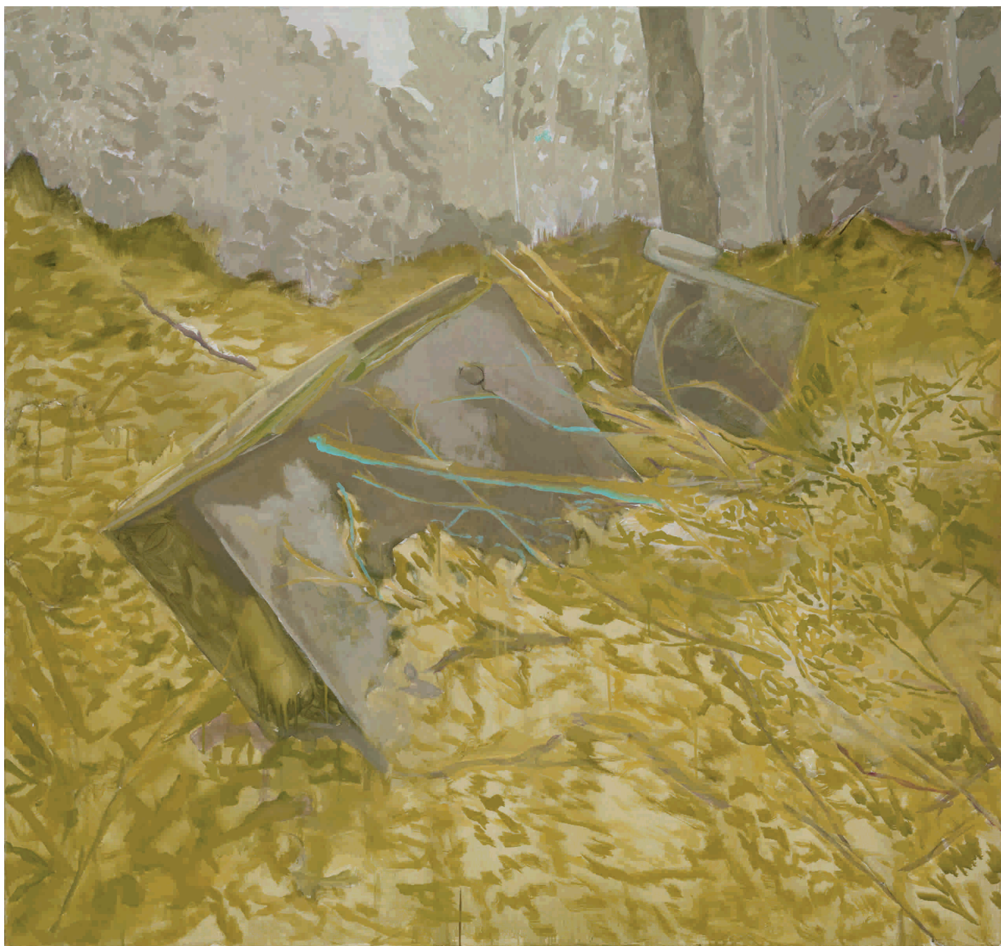
Na kraju, 2012. Akril na platnu 150x140 cm