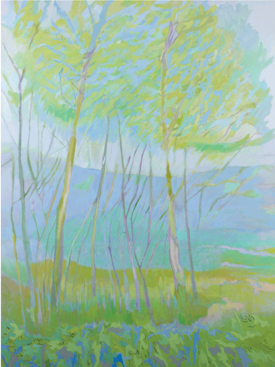
Bez naziva, 2012. Akril na platnu 150x200 cm