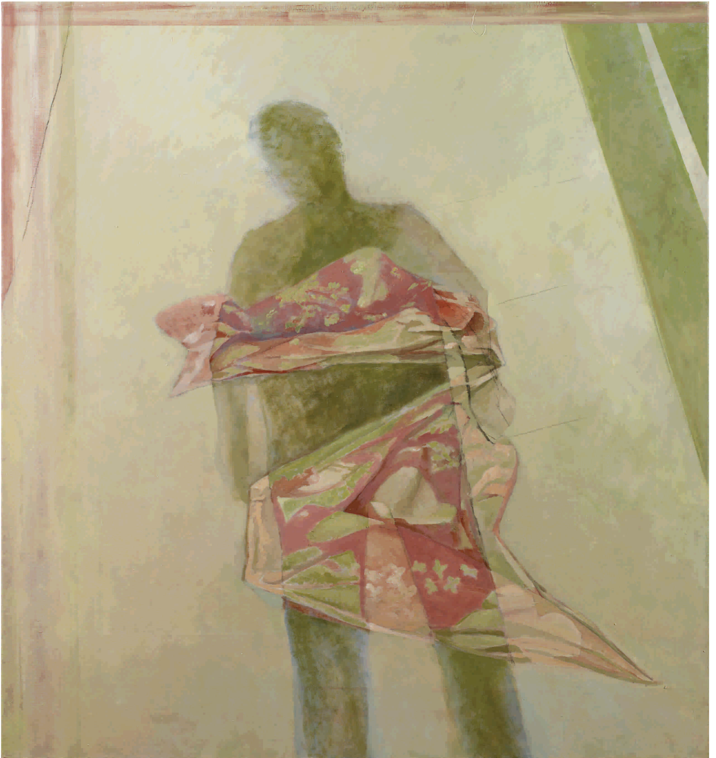
U sjeni , 2012. Ulje na platnu 140x150 cm