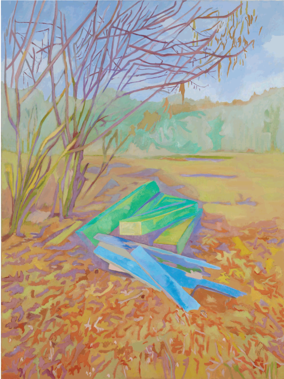
Jesen, 2012. Ulje na platnu 150x200 cm