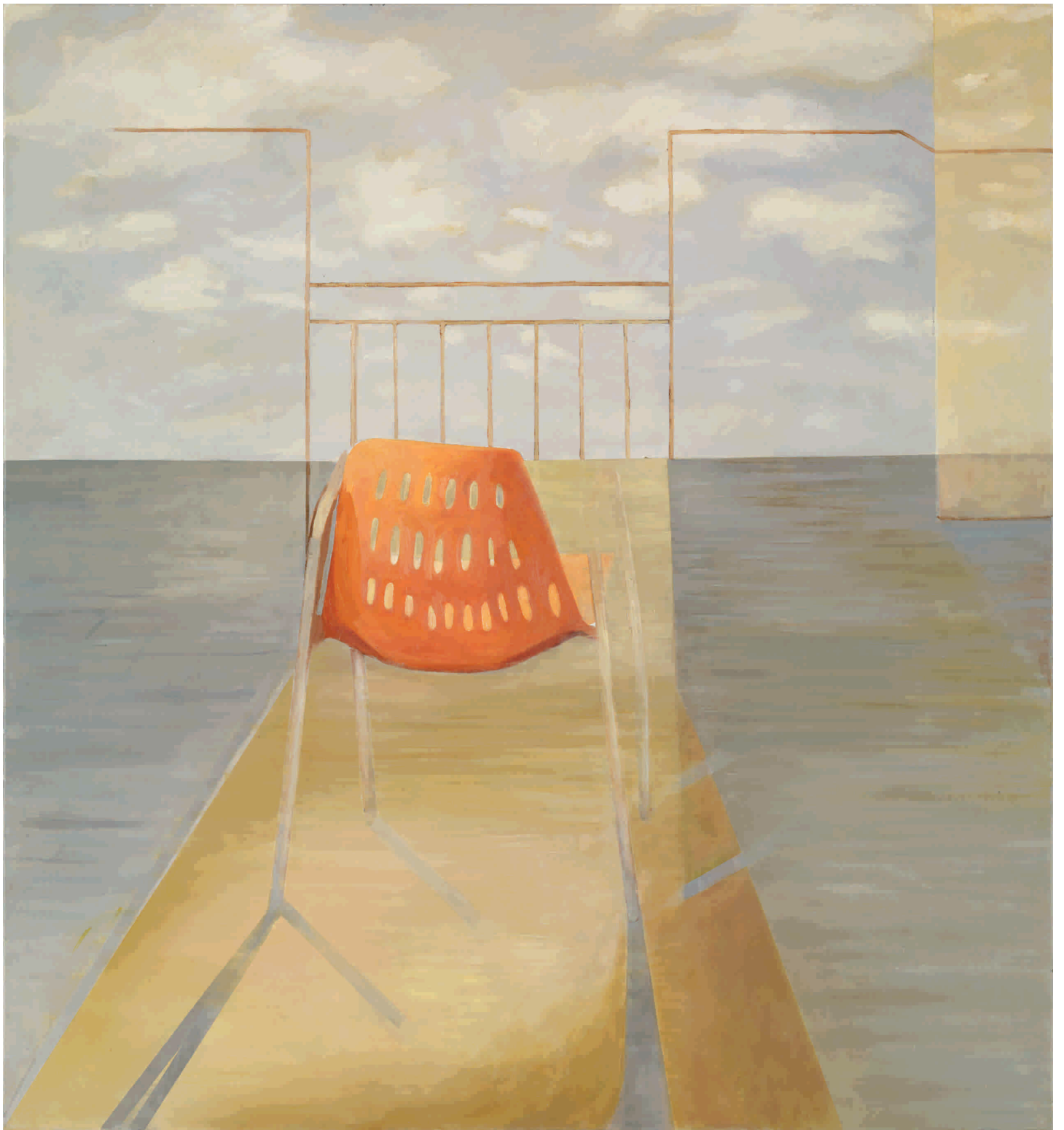
Meditacija, 2011. Ulje na platnu 140x150 cm