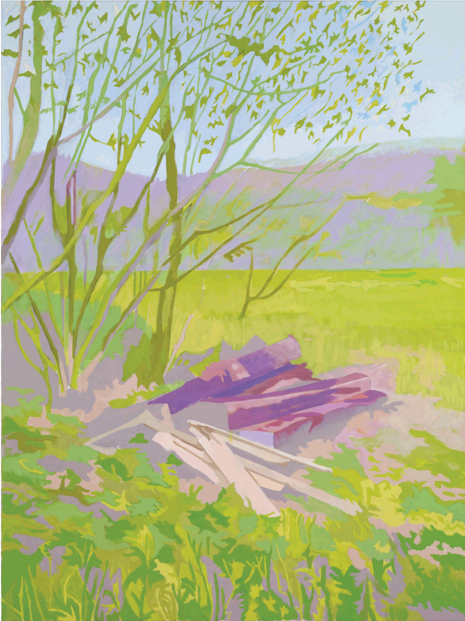
Proljeće , 2012. Akril na platnu 150x200 cm