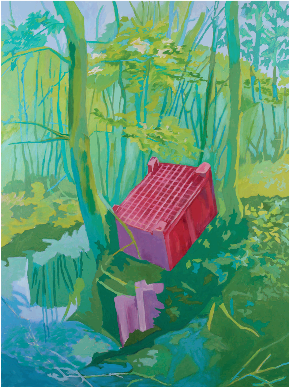
Šumski prizor, 2012. Akril na platnu 150x200 cm