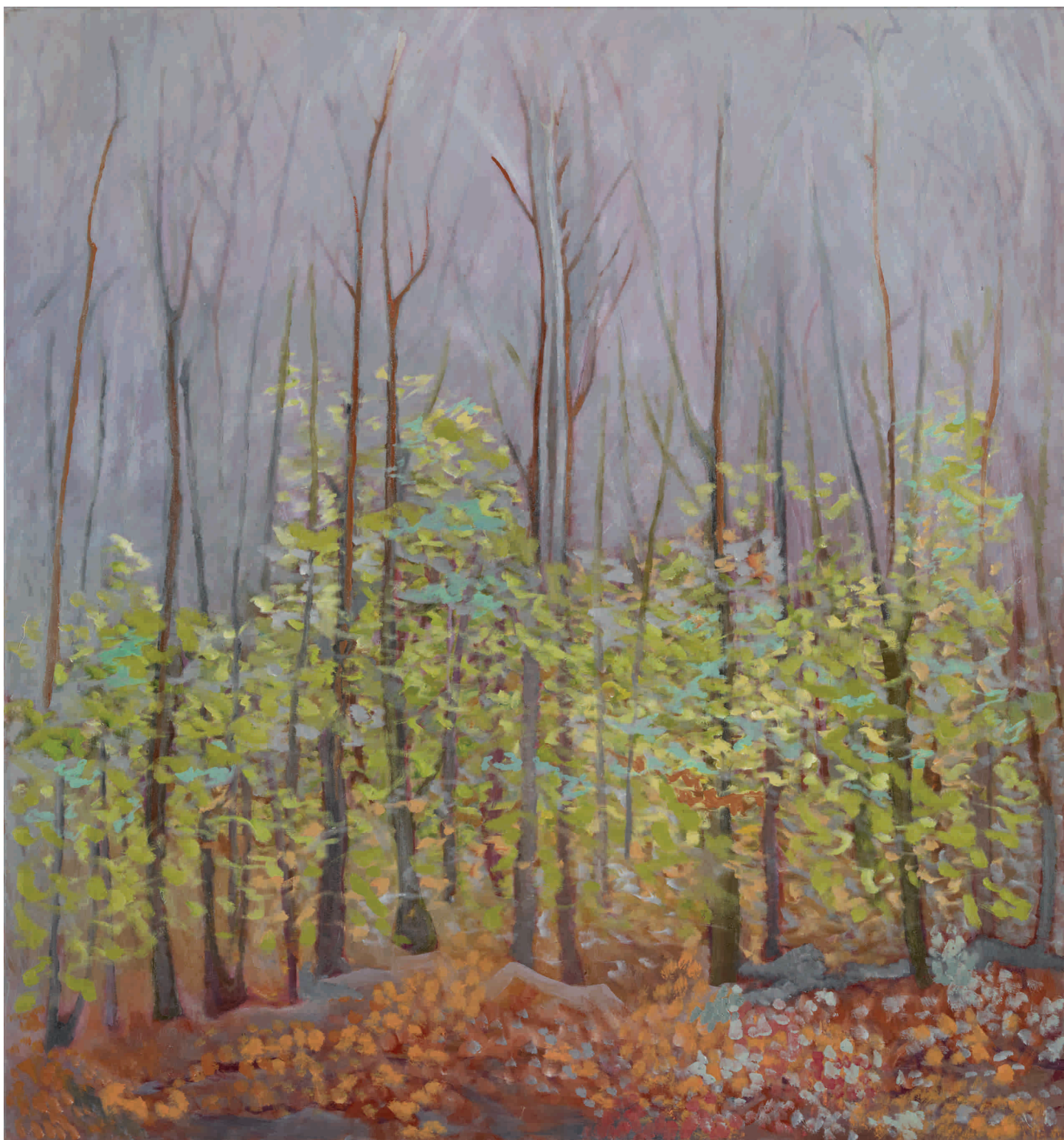
Studení, 2012. Ulje na platnu 140x150 cm