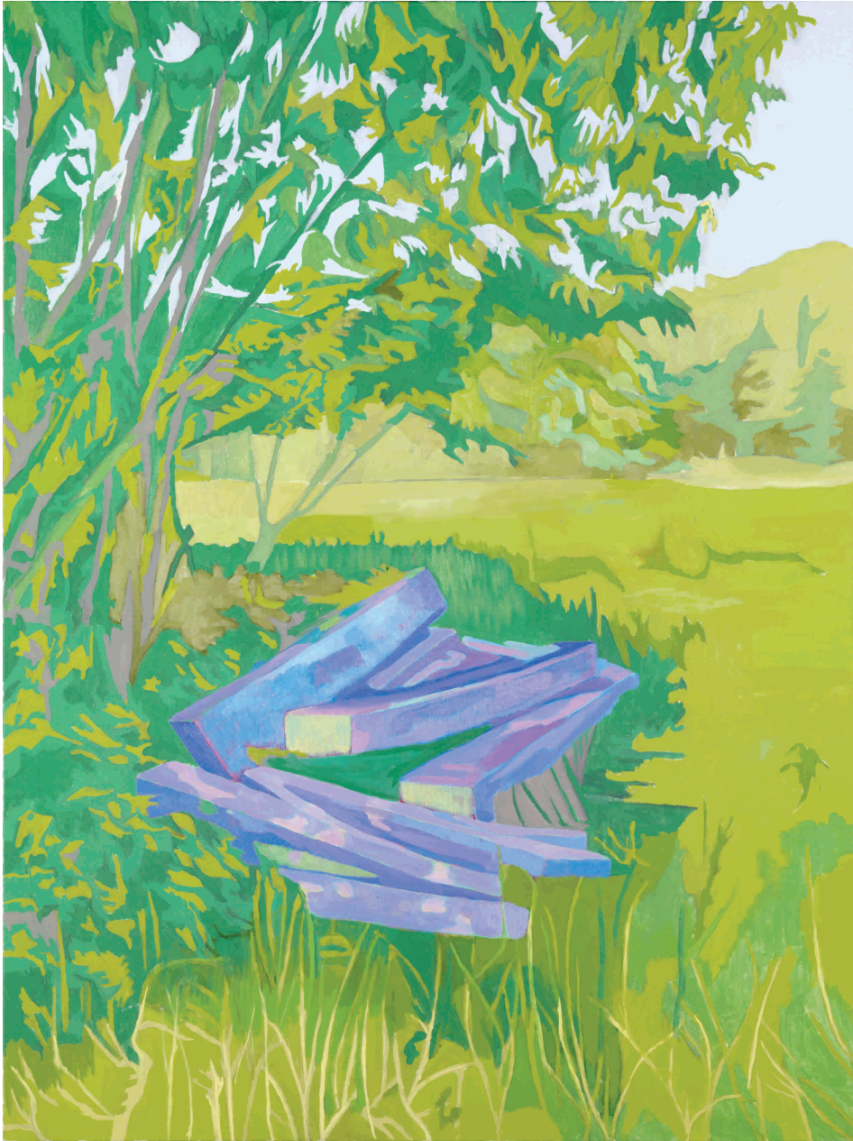
Ljeto , 2012. Akril na platnu 150x200 cm