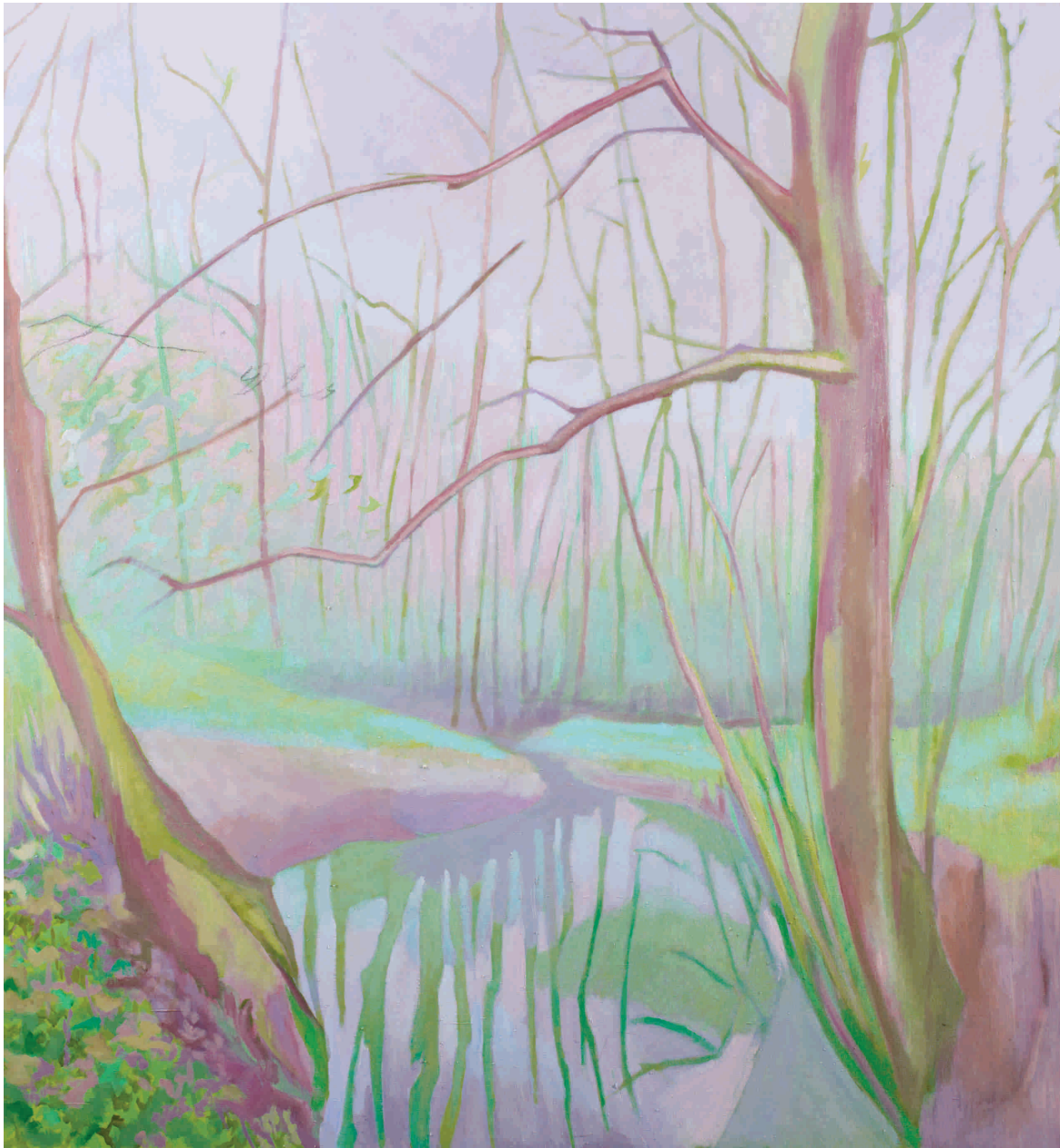
Kad se priroda budi, 2012. Ulje na platnu 140x150 cm