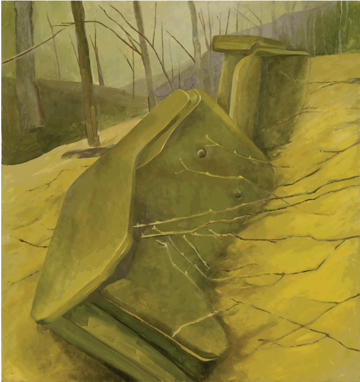
Bez budućnosti, 2012. Ulje na platnu 140x150 cm