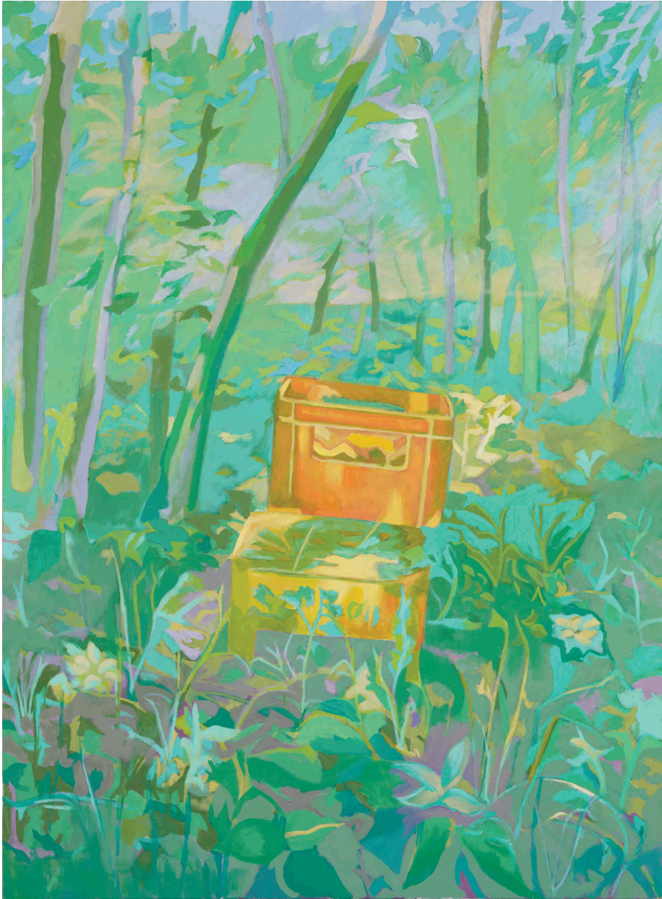
Na rubu šume, 2012. Akryl na platnu 150x200 cm