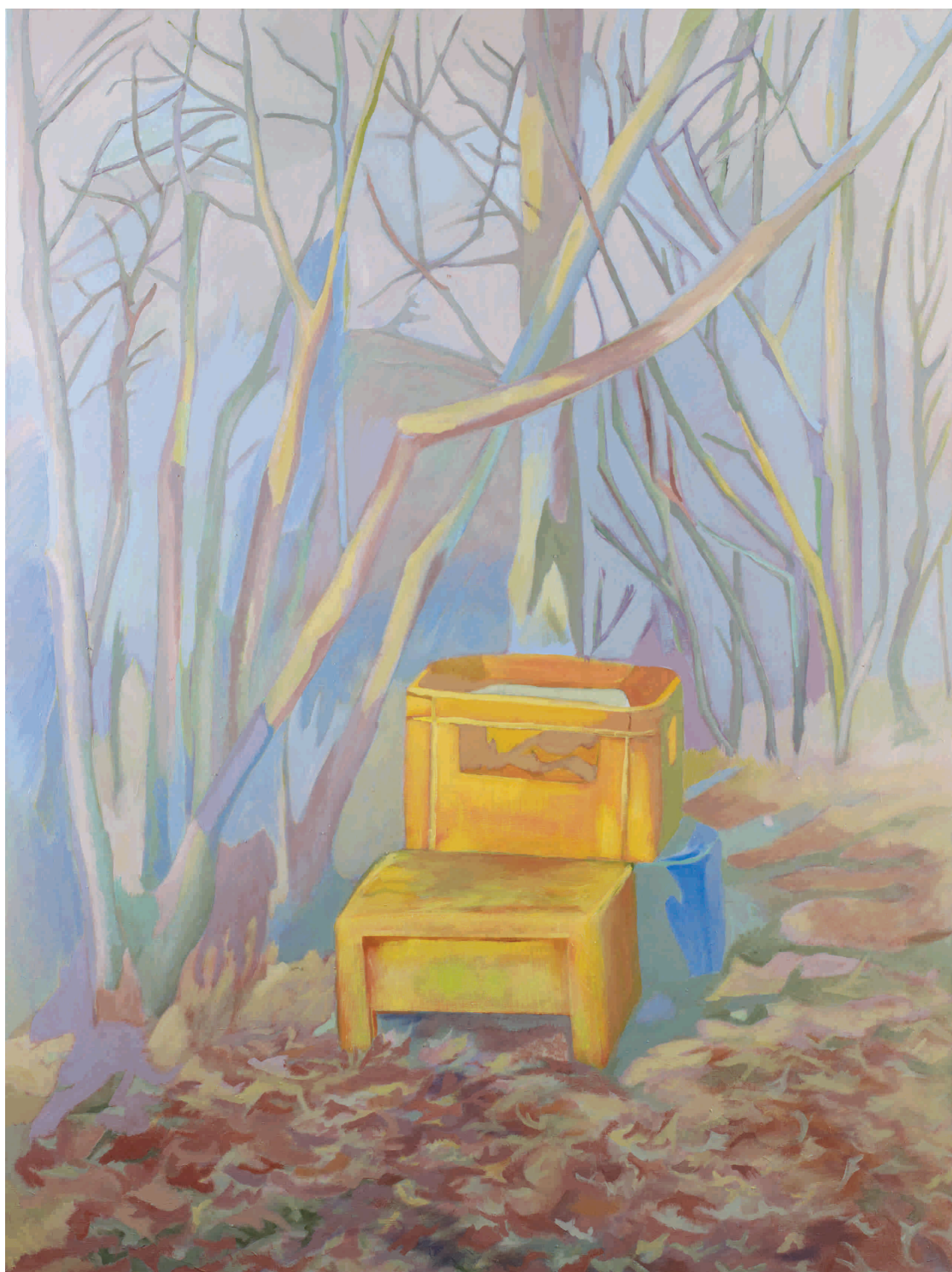
Veljača , 2012. Akril na platnu 150x200 cm