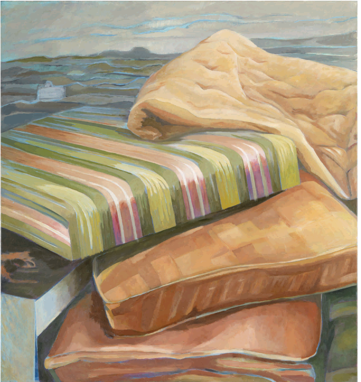
Veliko čiščenje, 2011. Akril na platnu 140x150 cm