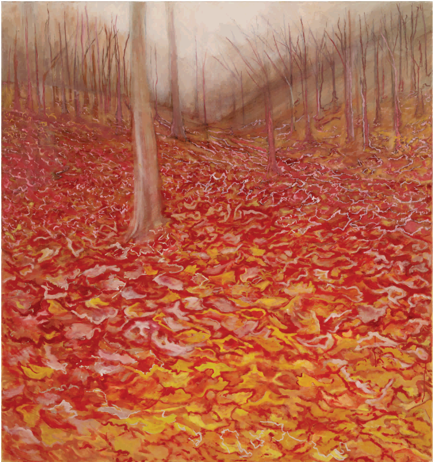
Šuškanje 2 , 2012. Ulje na platnu 140x150 cm