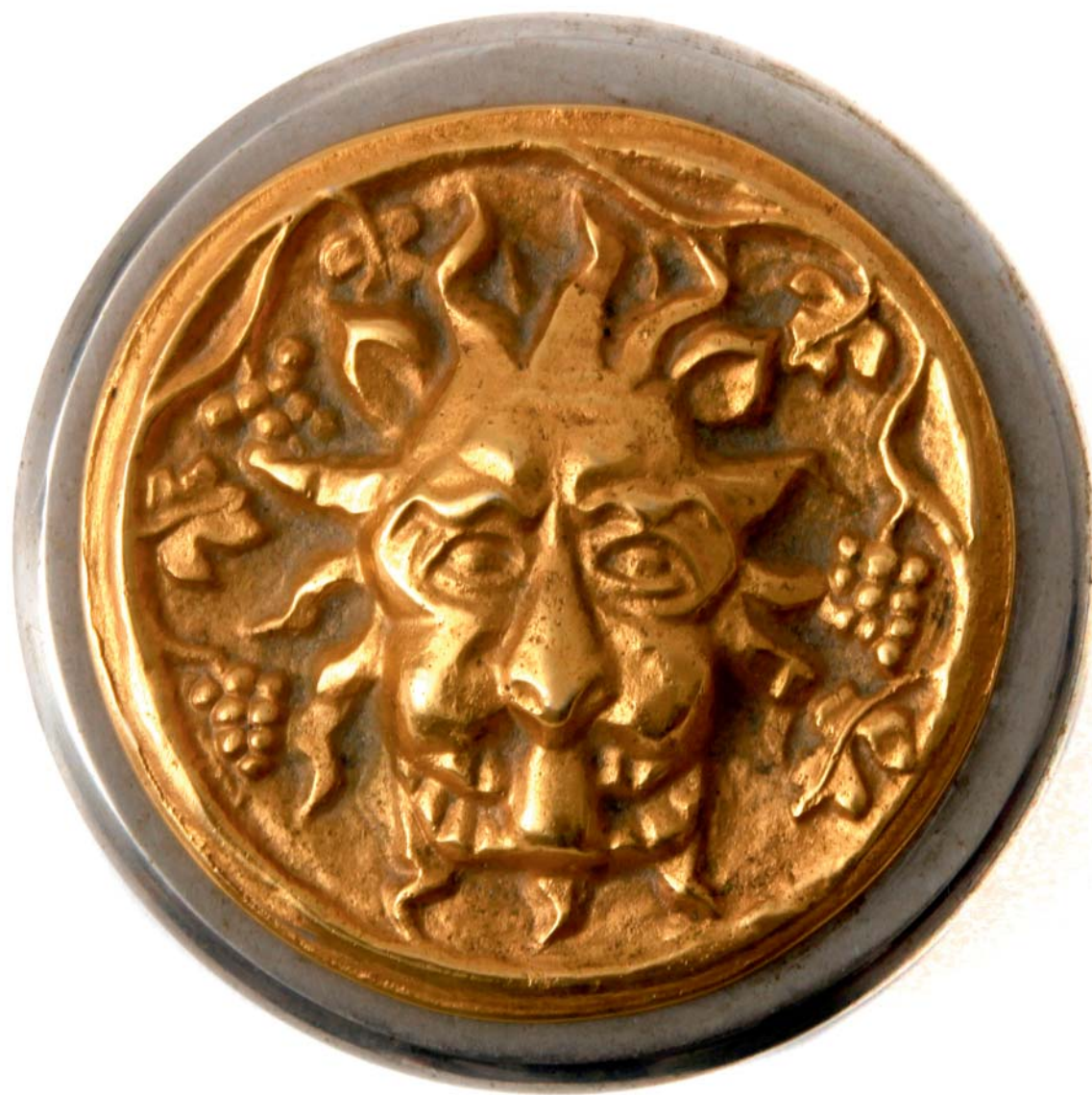
Maskeron, 1984., kat. br. 42