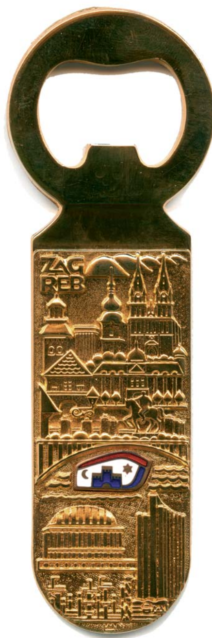
Otvarač za boce, 1979., kat. br. 84