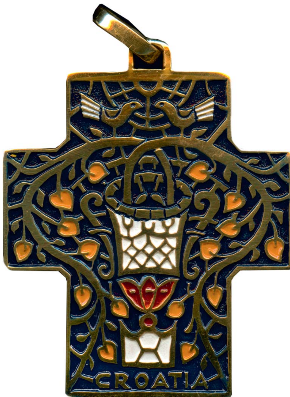
Križ s motivom mozaika iz Porečke bazilike, 2001., kat. br. 80