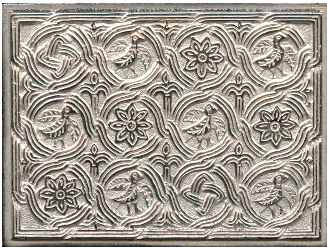
Predromanički pleter sa pticama iz Koljana kod Knina, 1969., kat. br 92