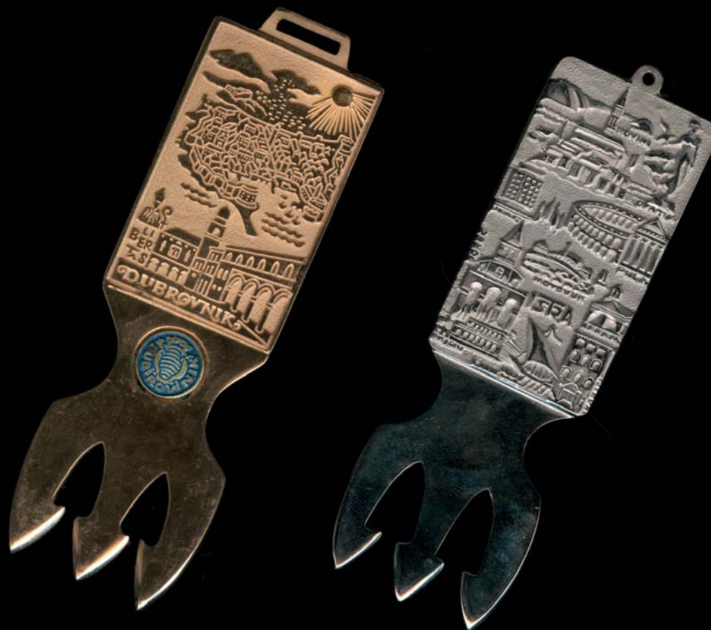
Osti – Dubrovnik, 1990., kat. br. 88