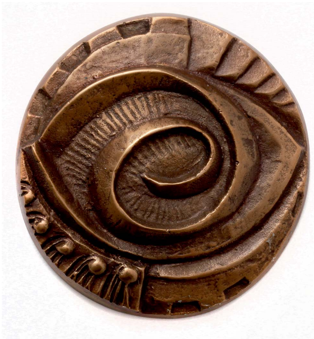
Glazba, 1987., kat. br. 46 (detalj na str. 9-10)