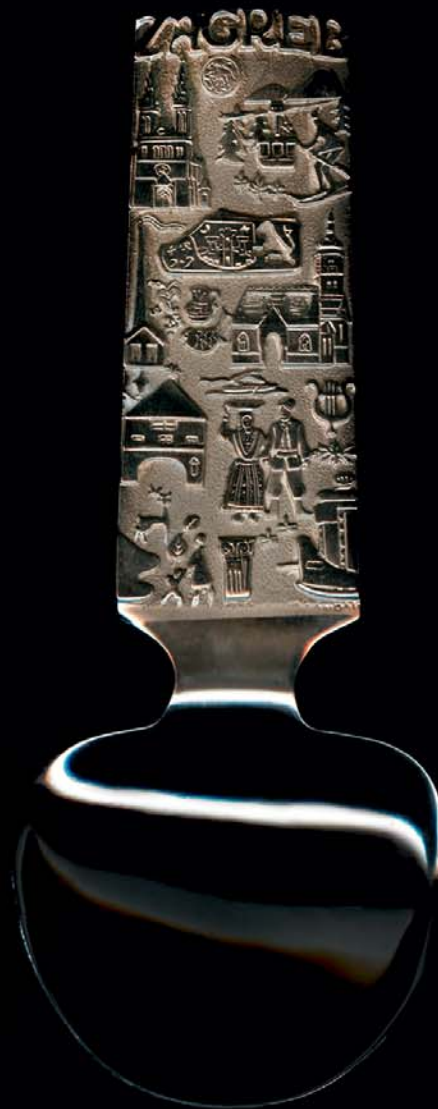
Žlica – Zagreb, 1965., kat. br. 86