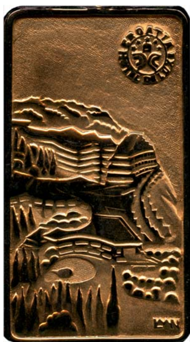
Cavtat, 1979., kat. br. 28