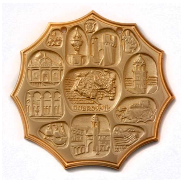
Dubrovnik, 1979., kat. br. 29