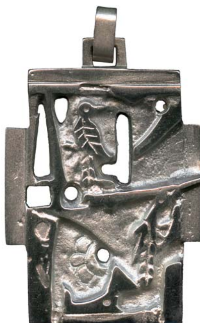
Privjesak s motivom ptica, 1970., kat. br. 67