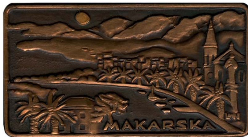
Makarska, 1987., kat. br. 45