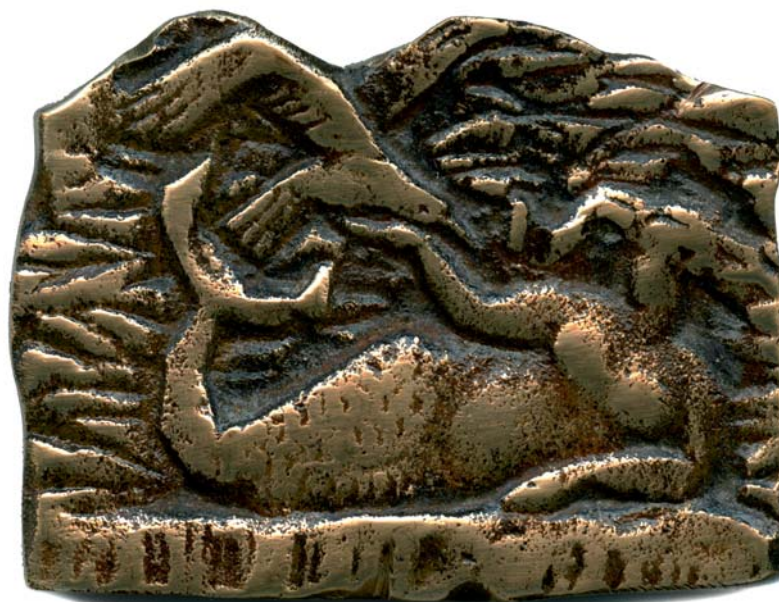
More, 1979., kat. br. 31