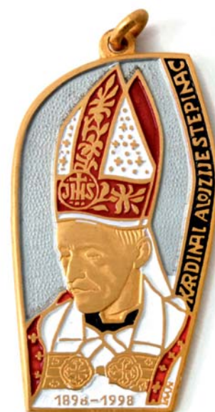
Kardinal Alojzije Stepinac, 1998., kat. br. 79