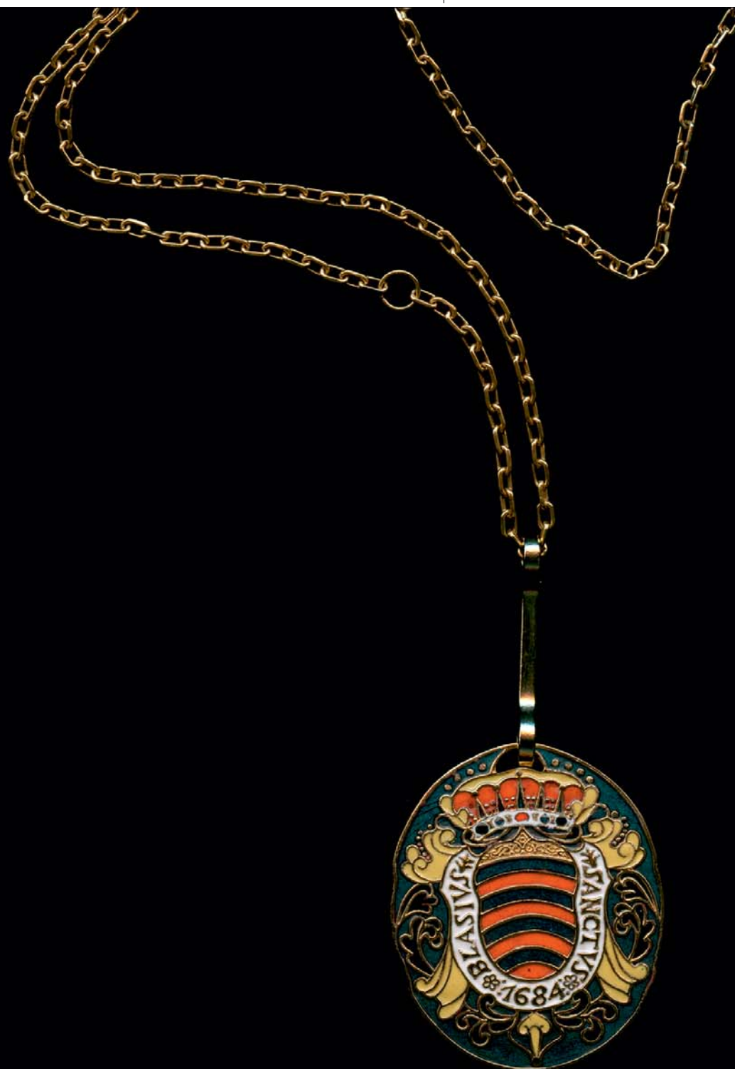
Sanctus Blasius, 1983., kat. br. 38