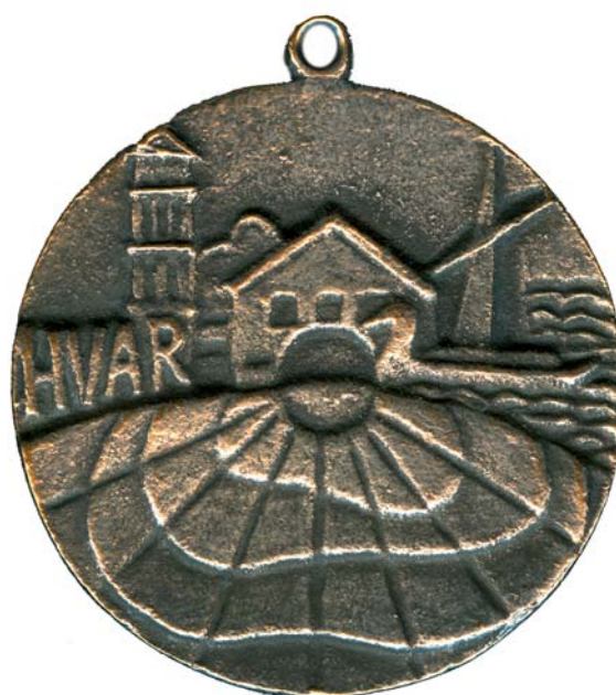
Hvar, 1972., kat. br. 9