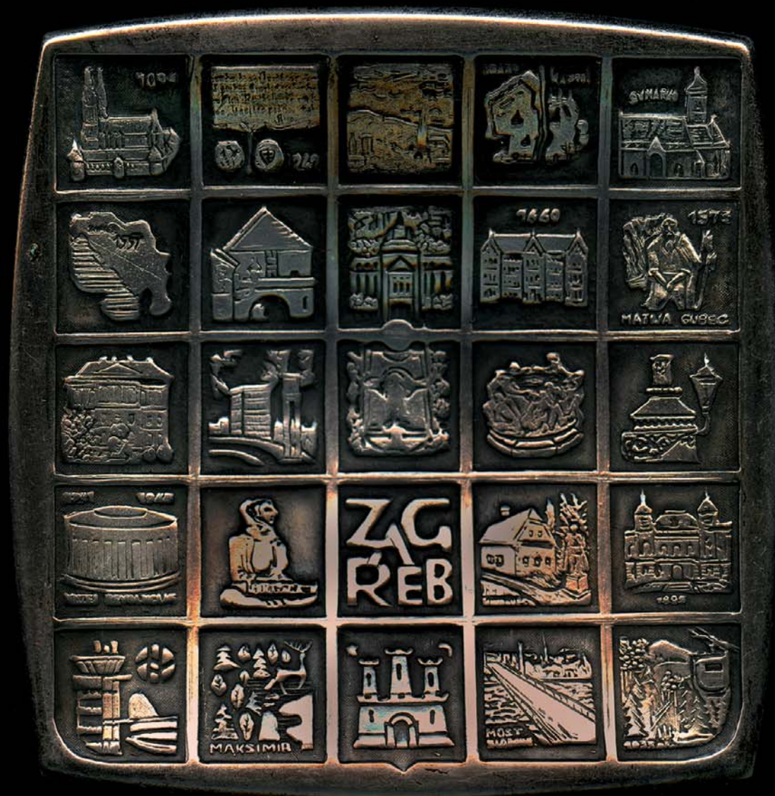
Zagreb «Grb» 25 polja, 1966., kat. br. 1