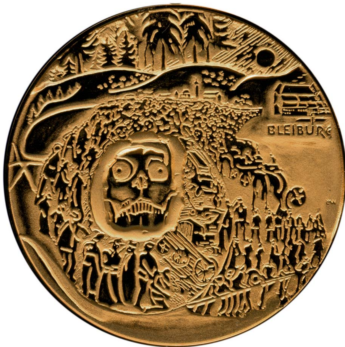
Bleiburg, 1975., kat. br. 59