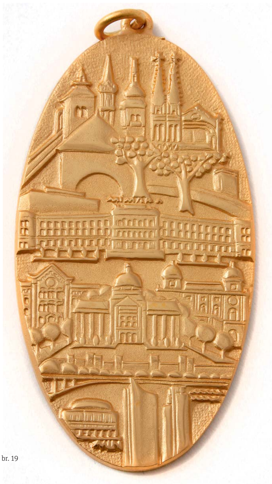
Zagreb, 1974., kat. br. 19