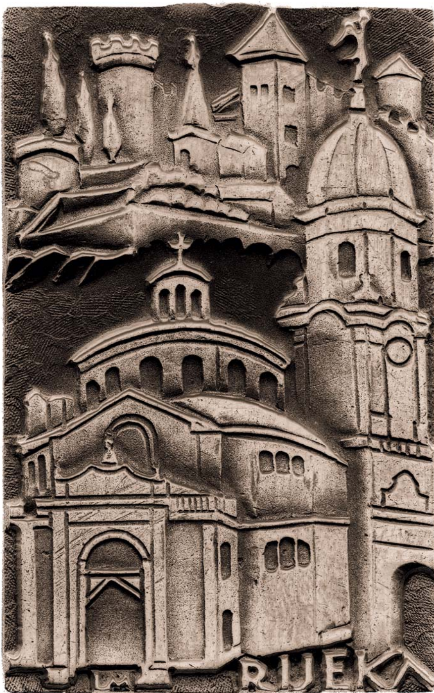
Rijeka, 1977., kat. br. 25