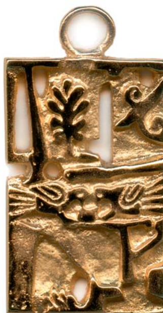
Privjesak s motivima ptica, 1990., kat. br. 74