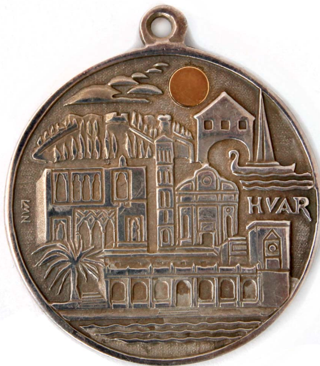
Hvar - sunce, 1981., kat. br. 35