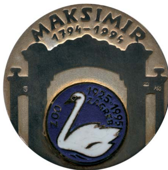
Maksimir, 1925.-1995., kat. br. 52