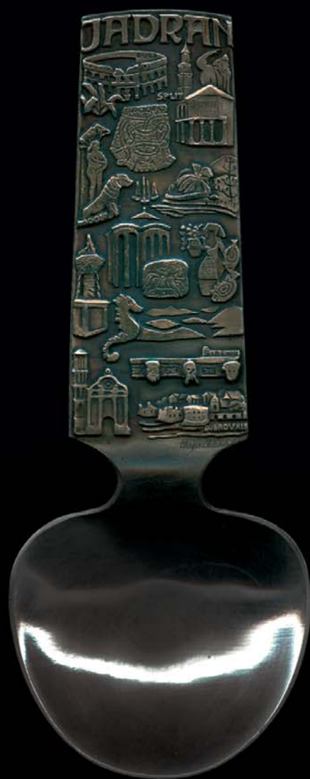
Jadran – žlica, 1966., kat. br. 83