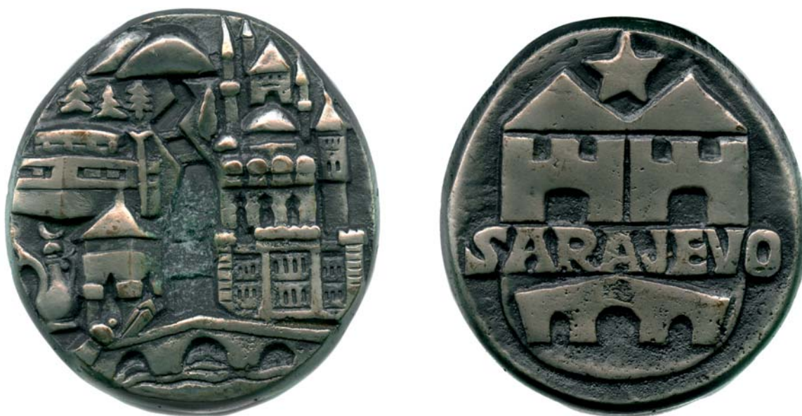
Sarajevo, 1974., kat. br. 16