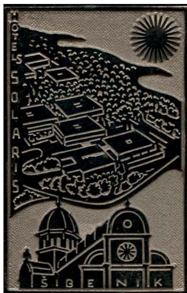
Šibenik, 2010., kat. br. 61