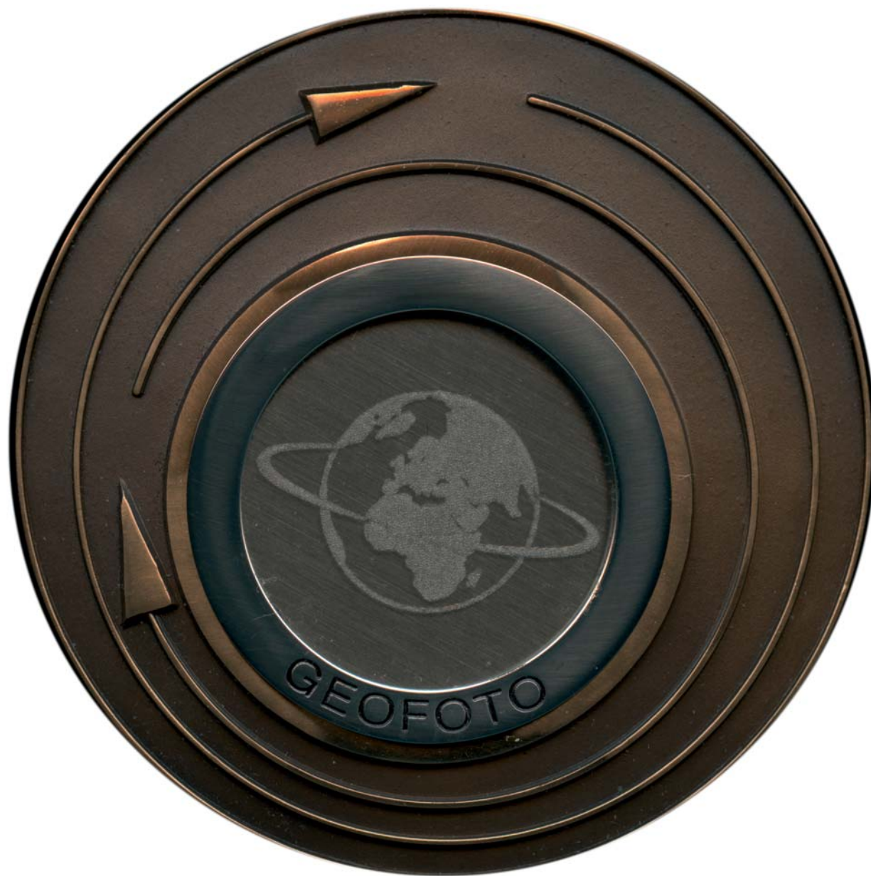
Geofoto, 2008., kat. br. 60