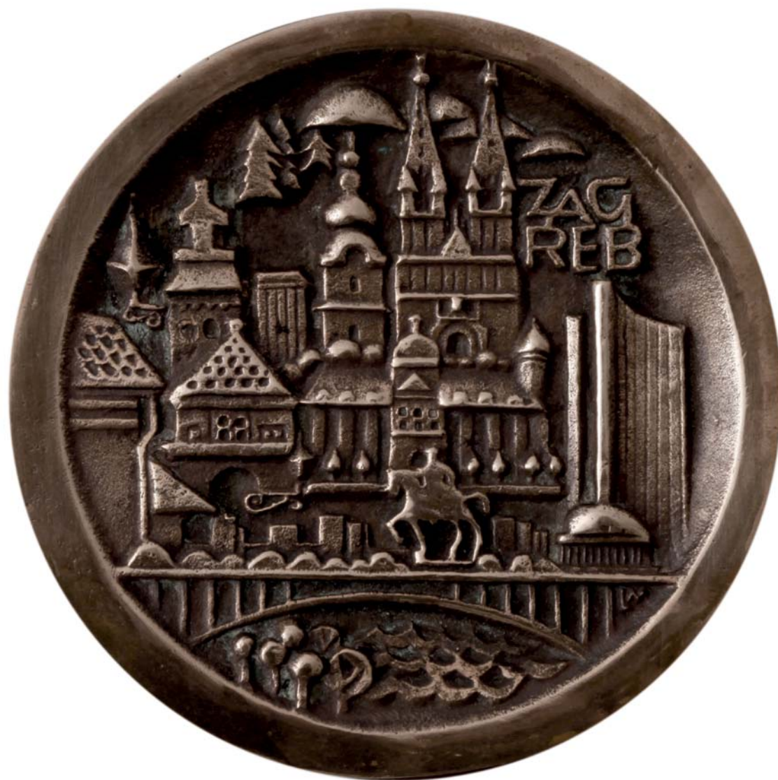
Zagreb, 1974., kat. br. 14