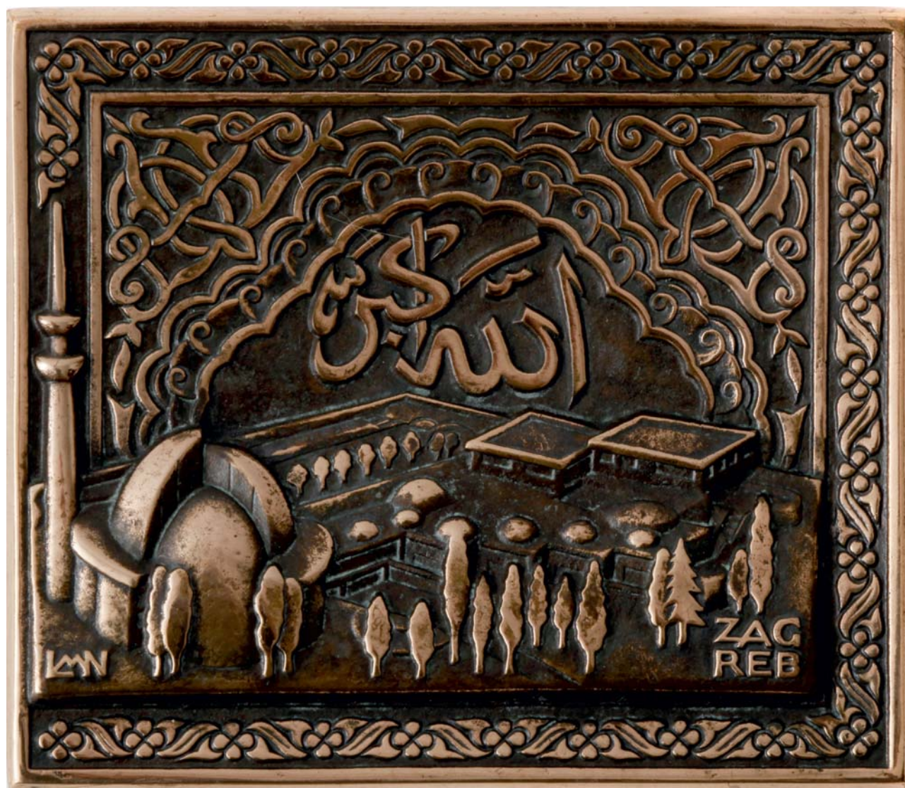
Zagreb - džamija, 1984., kat. br. 40