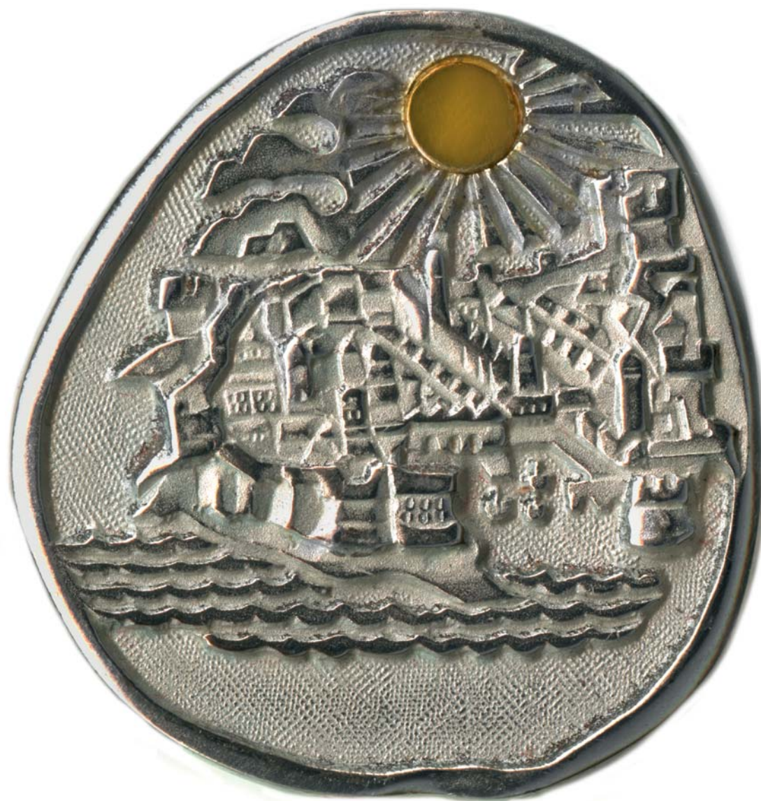
Zlatno sunce Dubrovnika, 1977., kat. br. 24