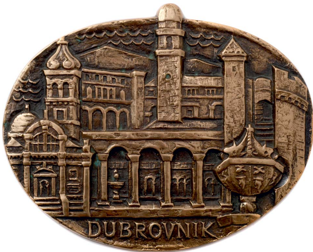
Dubrovnik, 1971., kat. br. 7