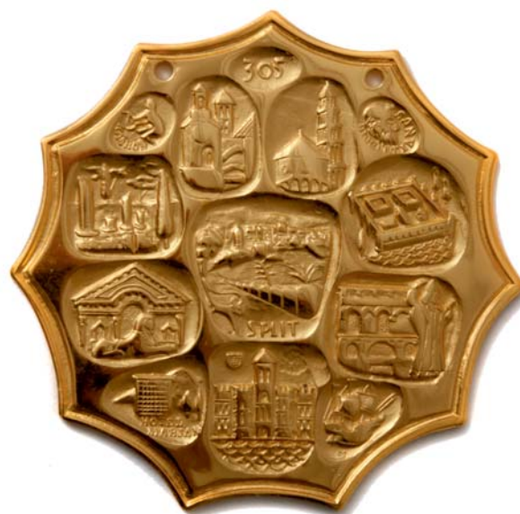
Split, 1978., kat. br. 26