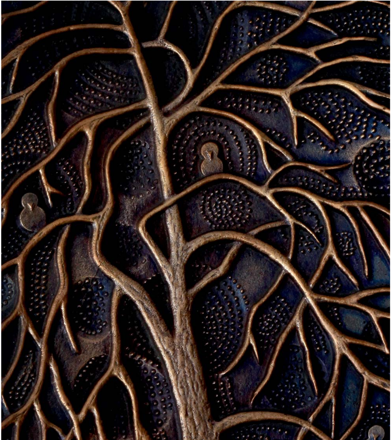
Stablo, 1970., kat. br. 6