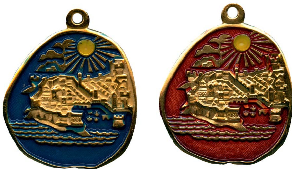
Dubrovnik, 1979., kat. br. 30