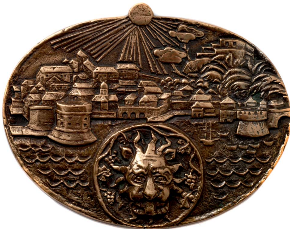
Dubrovnik, 1971., kat. br. 7