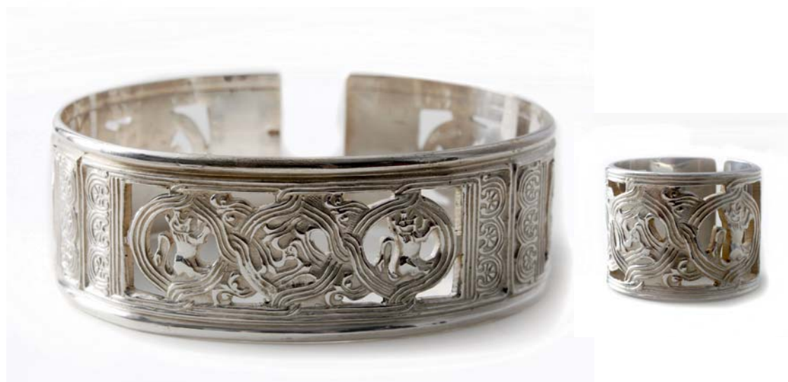
Set srebrnog nakita (ogrica s privjeskom, prsten i narukvica) 1994., kat. br. 77