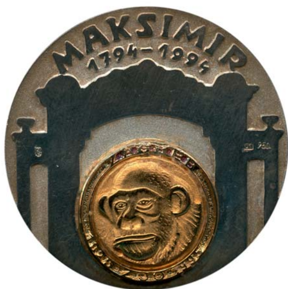
Maksimir 1794.-1994.,1994., kat. br. 51