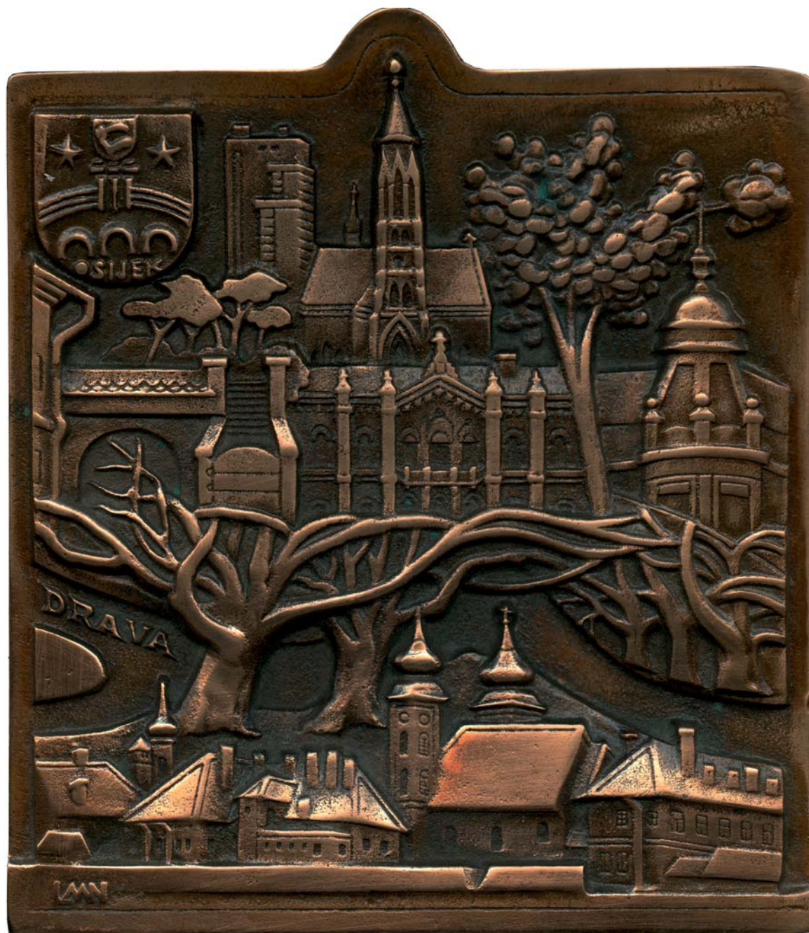
Osijek - Drava, 1983., kat. br. 37