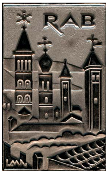
Rab, 1974., kat. br. 17