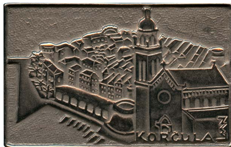
Korčula, 1978., kat. br. 27